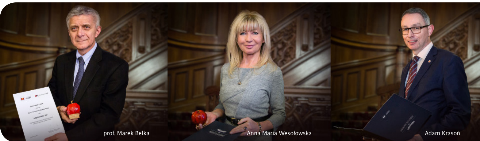
prof. Marek Belka

Wykłady Eksperckie to cykliczne spotkania z Absolwentami VIP naszej Uczelni, podczas których podejmowane są tematy związane m.in. z rozwojem Uczelni w kontekście wyzwań gospodarczych i geopolitycznych oraz globalnych trendów w zmieniającym się świecie. Wykłady Eksperckie to także znakomita okazja do osobistego spotkania się z najwybitniejszymi absolwentami UŁ.